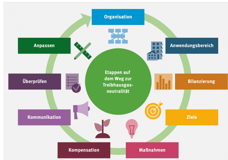
Abb. 3: Etappen auf dem Weg zur Treibhausgasneutralität 14

Für die Aussagekraft einer Bilanz ist es wichtig, einen nachvollziehbaren und geeigneten Bilanzrahmen zu definieren und zu dokumentieren. Da die THG-Bilanzierung die Grundlage für die Etablierung einer Klimastrategie darstellt, sollten die Systemgrenzen so gewählt werden, dass sie den geforderten Zweck erfüllen und alle relevanten Aktivitäten des Zentrums umfassen: